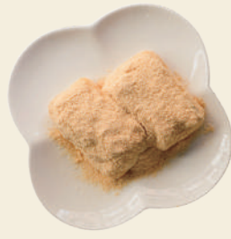
にしき餅 あべ川餅(きな粉)