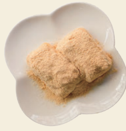
にしき餅 あべ川餅(きな粉)